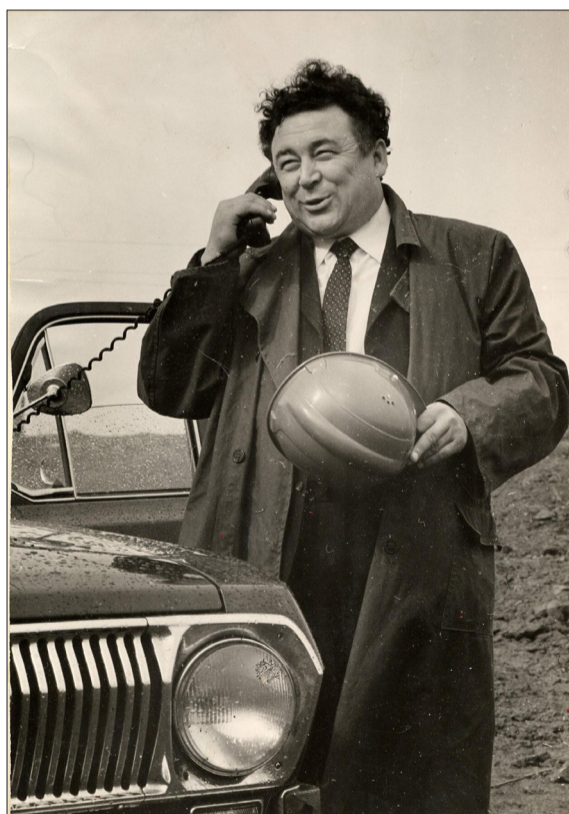
Так выглядела мобильная телефонная связь во времена СССР