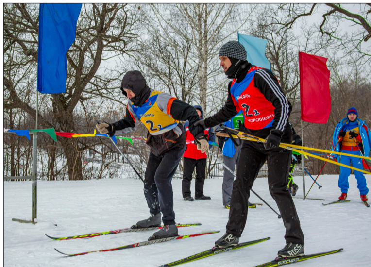
Передача эстафеты