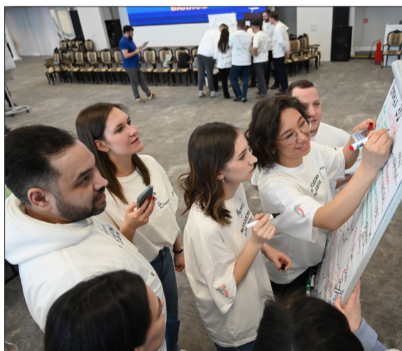
Мозговой штурм команд

Ленинградские нефтяники успешно выступили на Форуме молодых лидеров Компании