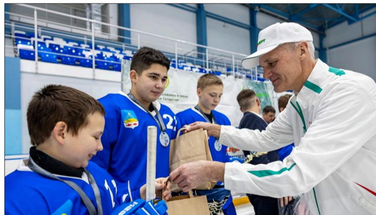
Награждение бронзовых призеров турнира — команды «Лаишево»