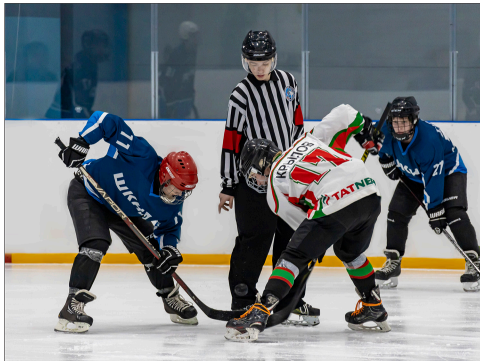
Ввод шайбы в игру

В Лениногорске состоялся IV турнир по хоккею с шайбой «Шугалак» среди команд воспитанников детских домов республики