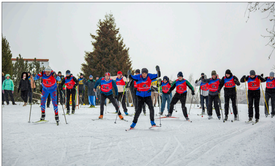
Участники соревнований по традиции стартовали от спорт-комплекса им. И. И. Хасанова

Очередные соревнования прошли в зачет спартакиады Лениногорской ТППО