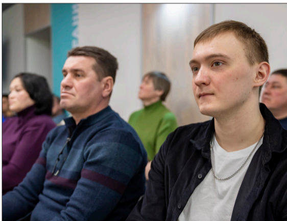
На форуме участники детально познакомились с изменениями в законодательстве в области охраны труда

нии травматизма и здоровьесберегающей деятельности.